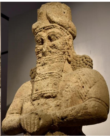
de god Nabû of Nebo