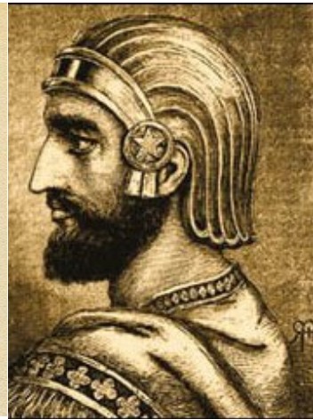
keizer Cyrus II (de Grote)