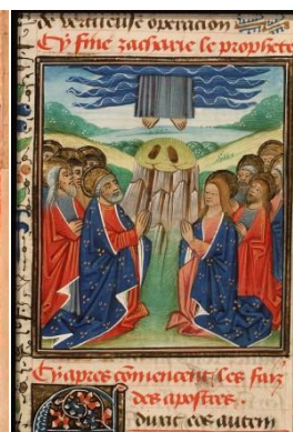
Hemelvaart met de voetafdruk v Jezus

Nabonidus de 5 e en laatste koning van het Neo-Babylonische rijk, op een stèle uit Harran, nu in het British Museum