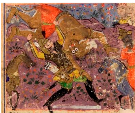
Ahriman, verslagen door een Perzische held