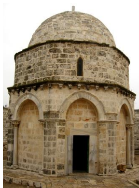
kapel vd Hemelvaart, Olijfberg, nu moskee